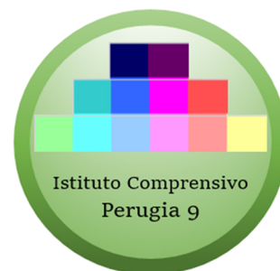
SOFIA E COSTANZA RAFFAELLI

All'interno di un cerchio verde (come il colore delle nostre campagne), sono racchiusi 12 mattoncini colorati (ognuno dei quali rappresenta una delle scuole dell'Istituto), disposti su 3 righe (una per ogni ordine di istruzione) e 6 colonne (una per ognuna delle frazioni dove le scuole sono ubicate).